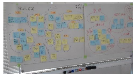
討議の成果物 F,G の例