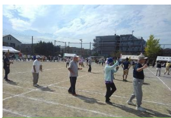
午後の1番民謡踊り