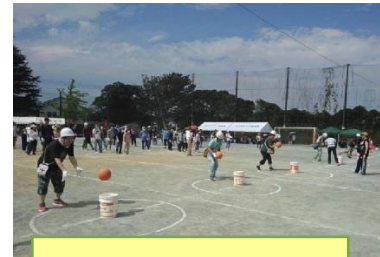
防災レースの風景