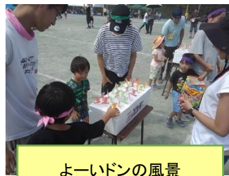
よーいドンの風景