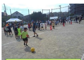
キックボールリレー