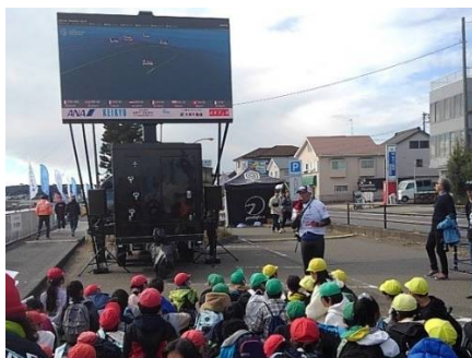
香村選手の講話を聴く 津久井浜小学校の児童