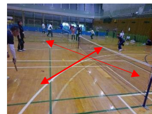
ディンクショット練習2 対角線上の相手に返す 相手はワンバンドして相手に返す