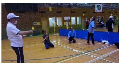
ラケットの中心にあてる練習