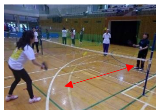
ディンクショット練習1 正面の方と1対1 ノーバウンドで返す