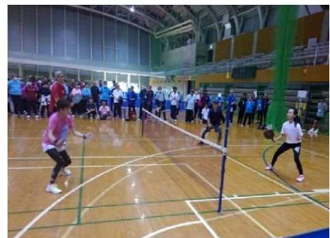
試合状態・モデル