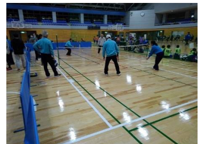
上記④デングゲーム