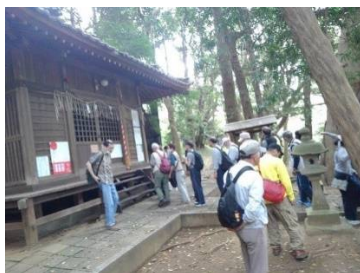
須軽谷八幡神社 参拝