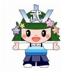
地域のマスコットキャラクター: 武丸