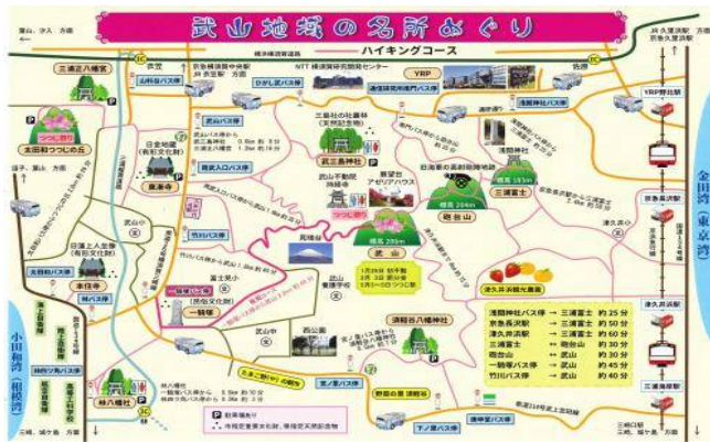
← 武山地域名所めぐり

参加された4名の方の方の声で、5歳児と母「楽しかったです、後半少し疲れたが何とか歩けました」「知らなかった地域のこと、以前からなぜだろうと思っていたことがいくつか分かった」「初めて参加したが楽しい！この行事は年に何回やっているの？」1回です。この声10人近くの方から言われた。「毎年楽しみにしているよ」