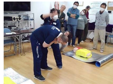
vものが詰まったときの対応