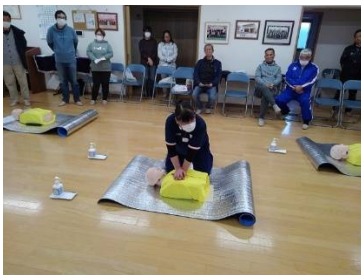
実際にやり方を示す