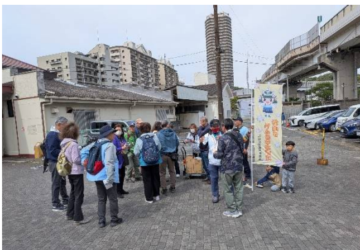
集合は JR 横須賀駅横 武丸も見える

歩くことが主の方にはもっと歩きたい、歴史好きの方には時間が足りないもっとゆっくり見て回りたいとの声が聞こえてきました。 やはり地元のことをよく知っている方が多く、クイズ形式で何問か行いましたすぐに正解の人、中には話す前に話を始める人も散見されました、参加は5歳～91歳の元登山家まで幅の広い層の方で約50名の参加を得ました。