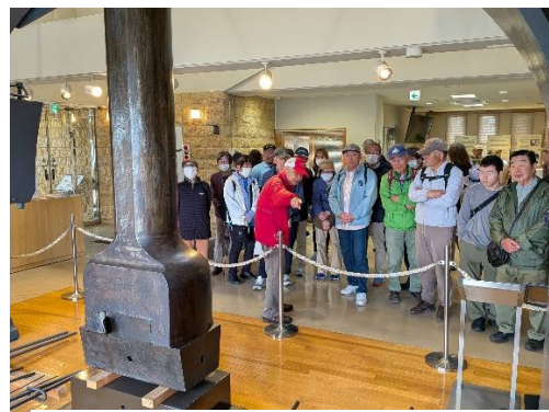
スチームハンマーの説明