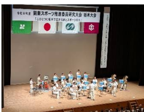
警察音楽隊の演奏