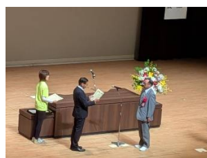
高橋さん受賞の場面